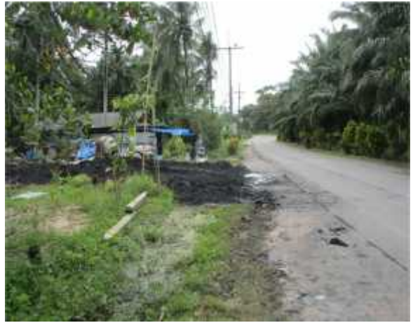
ดำเนินการเสร็จ